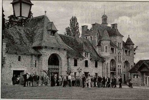
Cour intérieure du château des Dames

Dans le cadre de la 5 e édition des Monuments font le Printemps, organisée par le Conseil général, la visite historique, architecturale du château des Dames était l'ultime rendez-vous samedi 11 juin. Elle venait clôturer cette manifestation culturelle. La Société d'Histoire du Châtelet-en-Brie, qui avait organisé une exposition à cette occasion, a identifié et retranscrit le plus ancien document trouvé sur cet édifice, daté de 1314 : la donation de la terre origininaire du Châtelet par le roi Philippe le Bel à l'abbaye de Poissy. De cette ferme fortifiée ne reste que le vestige de la tour située au nord et sans doute quelques éléments de fondation. La période révolutionnaire verra le domaine vendu comme bien national. Alors que plusieurs propriétaires se succèdent au 19 e siècle,